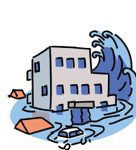
地震・噴火による津波