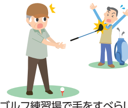
ゴルフ練習場で手をすべらし、クラブが隣の人にぶつかり、ケガをさせた。