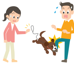
散歩中、飼い犬が通行人に噛みついてケガをさせた。