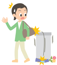
買い物中、誤って商品を割ってしまった。