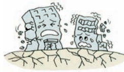
②地震で建物が倒壊した