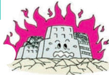
①地震で火災がおり建物焼けた